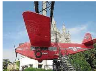
Aviò del parc d'atraccions del Tibidabo.

Com a detall a destacar, cal mencionar que, més que pels seus projectes d'enginyeria de gran volum i importància (trens metropolitans, grans envasaments d'aigua i funiculars) Santiago Rubió i Tudurí mereix la veu millor consideració per haver creat l'avió del parc d'atraccions