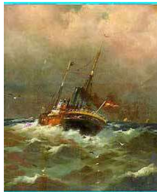
«Barco», oli sobre tela d'Hernández Monjo

D'altra banda, em segueix intrigant l'existència del veler de dos pals « Manuel » a més de 14.000 milles nàutiques de Menorca, unes 110 vegades la distància que hi ha entre Ciutadella i Barcelona i com va ser possible que se li dediqués un exvot, indici clar de que va tornar a port, encara