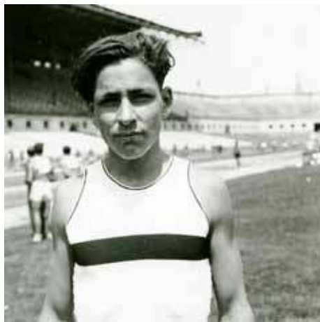
Doro Pons als Jocs Olímpics d'Amberes de 1920

Tot açò que dic, ara que els Jocs de Rio es-