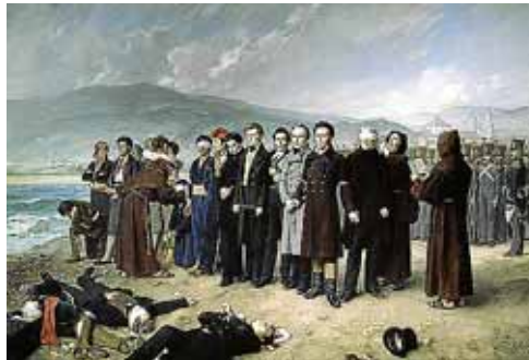
Fusilamiento de Torrijos

a todos», encara que just després de l'execució va donar una ordre d'alliberament que, òbviament va arribar tard. Entre els afusellats hi havia un mariscal de Camp, un antic president de les Corts, un exministre de la Guerra i fins a 48. De fet, l'ordre de que «los fusilen a todos», va ser complida del tot, ja que els 12 mariners que duïen les dues barques on anaven els «sublevats», també van ser passats per les armes.